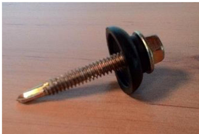
Hình ảnh đinh vít có đệm làm kín