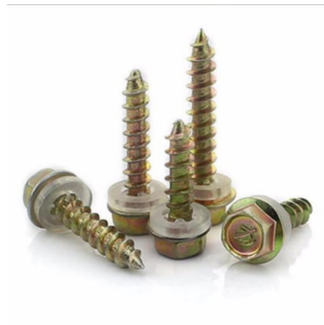
Hình ảnh vít dùng cho mè gỗ