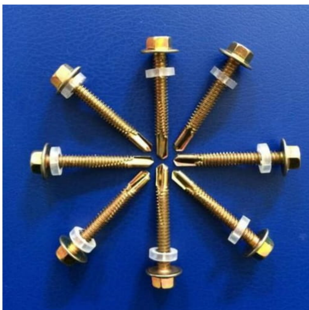
Hình ảnh vít dùng cho mè thép